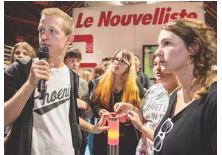
L'Ecole de commerce et de culture générale (ECCG) de Martigny a tenu le choc, ne perdant qu'en finale. LOUIS DASSELBORNE