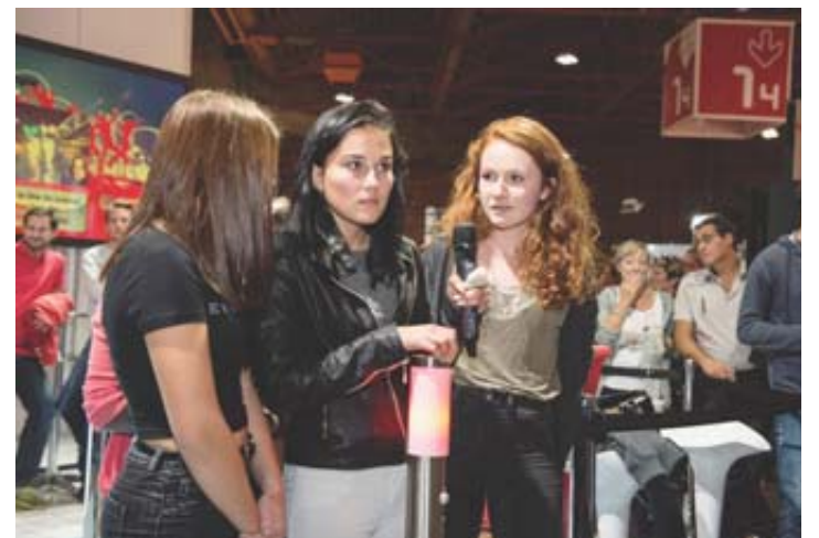
L'Ecole de commerce et de culture générale de Monthey a remporté le «derby» chablaisien. LOUIS DASSELBORNE